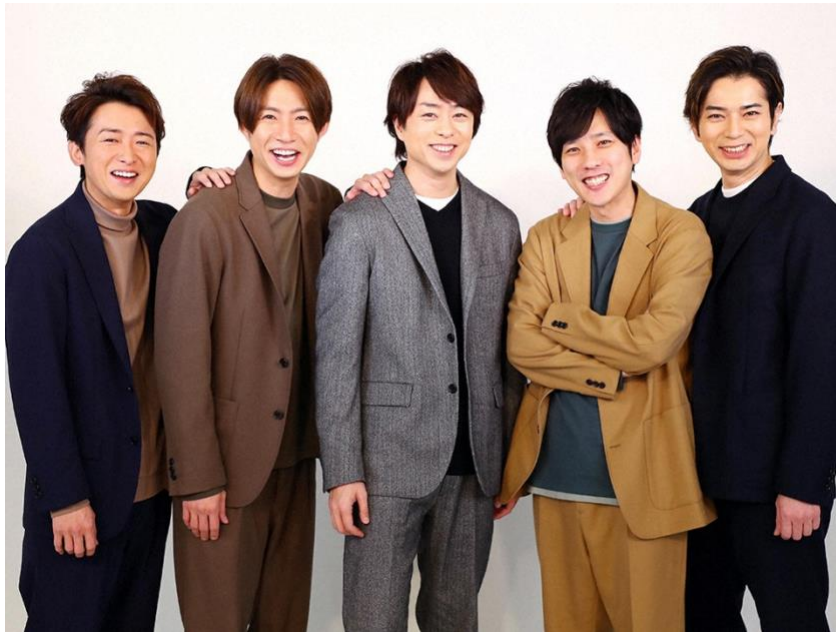
左から 大野智 相葉 雅紀 櫻井翔 二宮和 也 松本潤 の5人で 活動していた。

席が天井席であろうが、アリーナであろうがみんなが楽しめるようなコンサートを作るために努力をしている。そのため、他の後輩ジャニーズグループからも慕われる存在である。